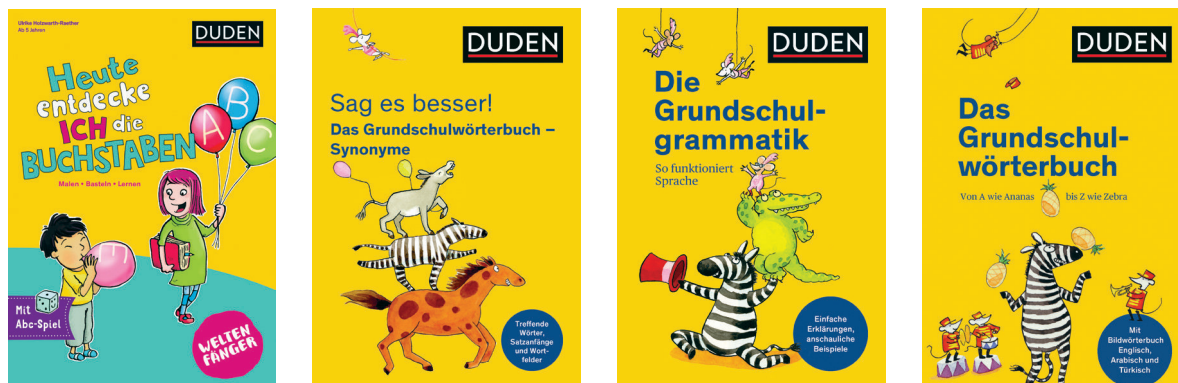
Heute entdecke ich die Buchstaben, Das Grundschulwörterbuch, Die Grundschulgrammatik, Sag es besser! Das Grundschulwörterbuch- Synonyme, Dudenverlag